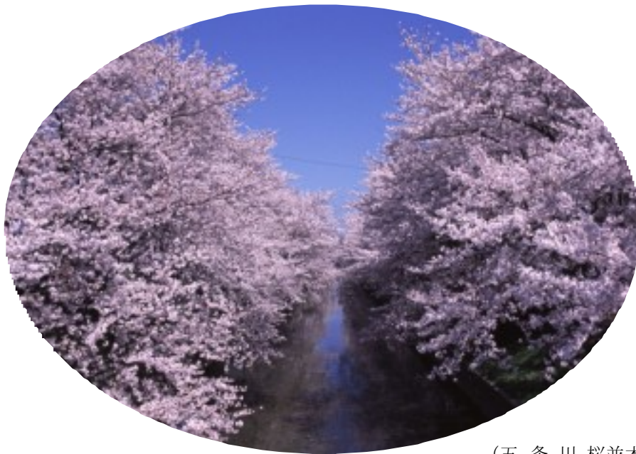
(五 条 川 桜並木)