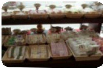
(精魂込めた様々な和菓子)

今は時代の流れとともに冠婚葬祭などの注文もなく、また甘い物もあまり食べられなくなってきました。