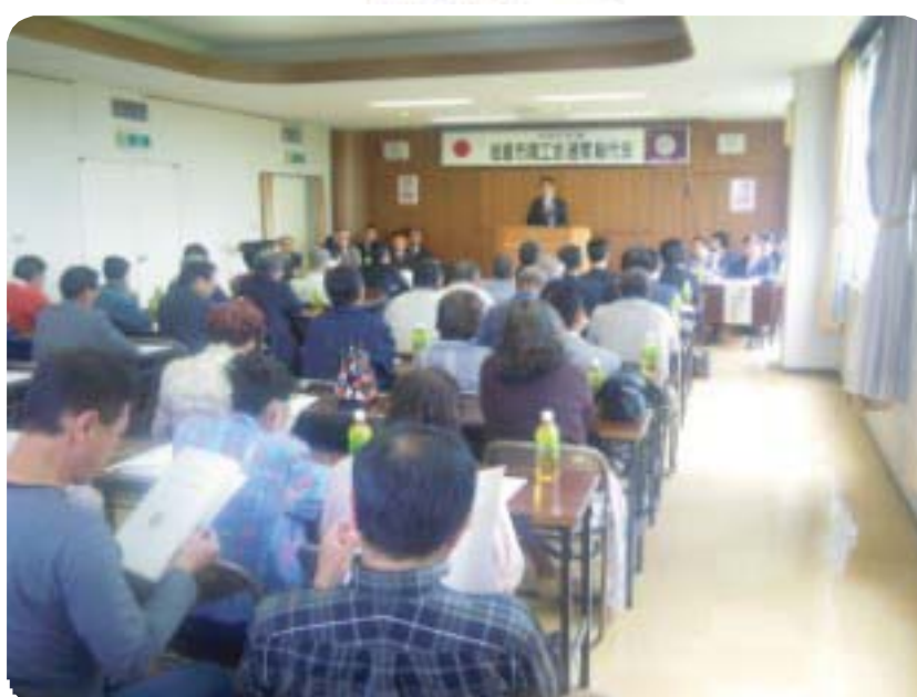
(平成22年度通常総代会)