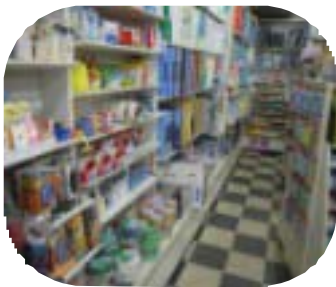
【アイテム毎に管理された店内】

文房具は現在、ホームセンターやコンビニなど、どこでも購入でき、安い物は100円均一、オフィス用品は通販などに客足が流れてしまうようになってきました。