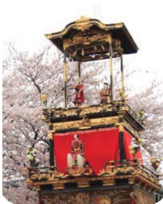
(「山車からくり」と桜並木)