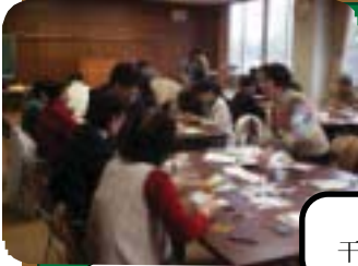
干支（卯）押絵作成講習会

12月13日商工会館で押絵作成を行いました。参加者は講師の手解きを受け干支の図柄の作品を作り、各々の作品は店舗等で一年間飾られることでしょう。