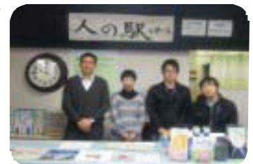
【明るいスタッフがお出迎え】

より多くの店舗様のご参加、ご協力をお願い致します。ご参加くださる店舗様は、申込書にご記入の上、4月6日までに「人の駅いわくら」にご提出をお願い致します。