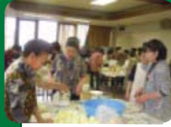
ゴキブリ団子作成講習会

12月13日商工会館で押絵作成を行いました。参加者は講師の手解きを受け干支の図柄の作品を作り、各々の作品は店舗等で一年間飾られることでしょう。