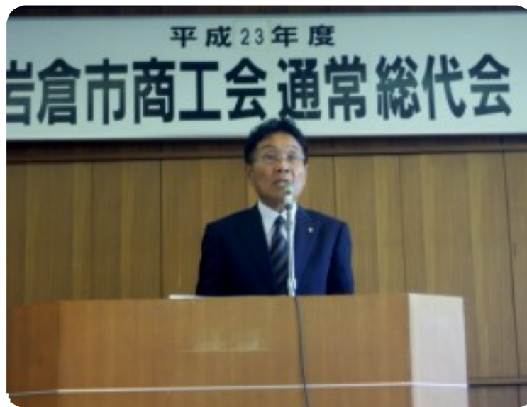
(平成23年度通常総代会)