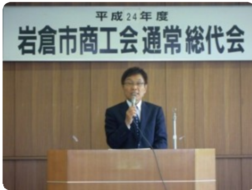
(平成 24 年度通常総代会)