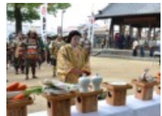
部員が参加しました。

平成二十四年十一月十日(土)・十一日(日)に岩倉市総合体育文化センターで開催された「五目はん」「とん汁」を販売しました。【一豊行列】のお千代役に今年も女性