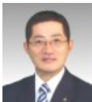
岩倉市長 片岡 恵一