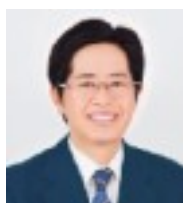
愛知県議會議員 高桑 敏直