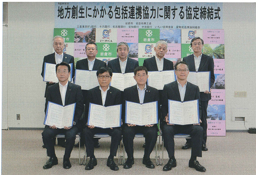
地方創生にかかる包括連携協力に関する協定締結式

平成28年7月7日（木）に岩倉市、市内7金融機関との三者により連携協定を締結しました。 この協定は三者の幅広い連携・協力関係により、互いの人的資源等を活用し、地方創生の諸課題に取り組むことで、新たな地域活力の創出に寄与することを目的としています。 この目的の達成のため、以下に掲げる5項目について連携・協力していきます。