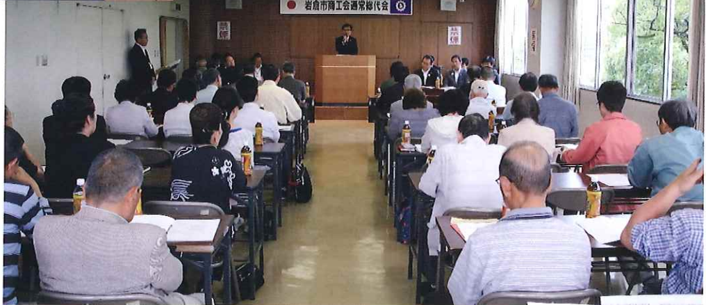
(第 57 回通常総代会)