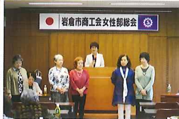
新部長と役員のみなさん