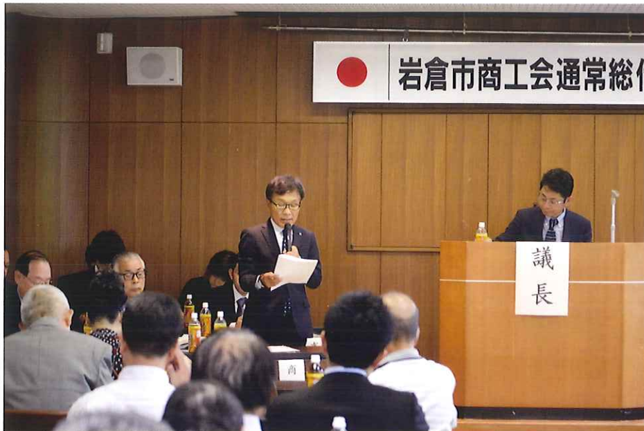
第58回通常総代会が平成30年5月18日に開催されました